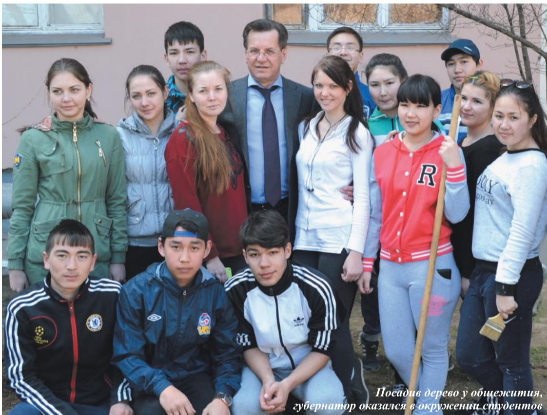
Посадив дерево у общежития, губернатор оказался в окружении студентов

Вполне справедливо считать апрель временем активного преобразования окружающей среды. Собственно, традиционный субботник в нашем колледже, равно как по региону в целом, состоялся 23-го числа, но процесс благоустройства студенты и сотрудники длили в течение всего месяца.